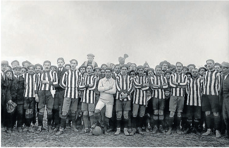
El Sport Club de Huesca, en el campo de la Estación en 1911. R. A.