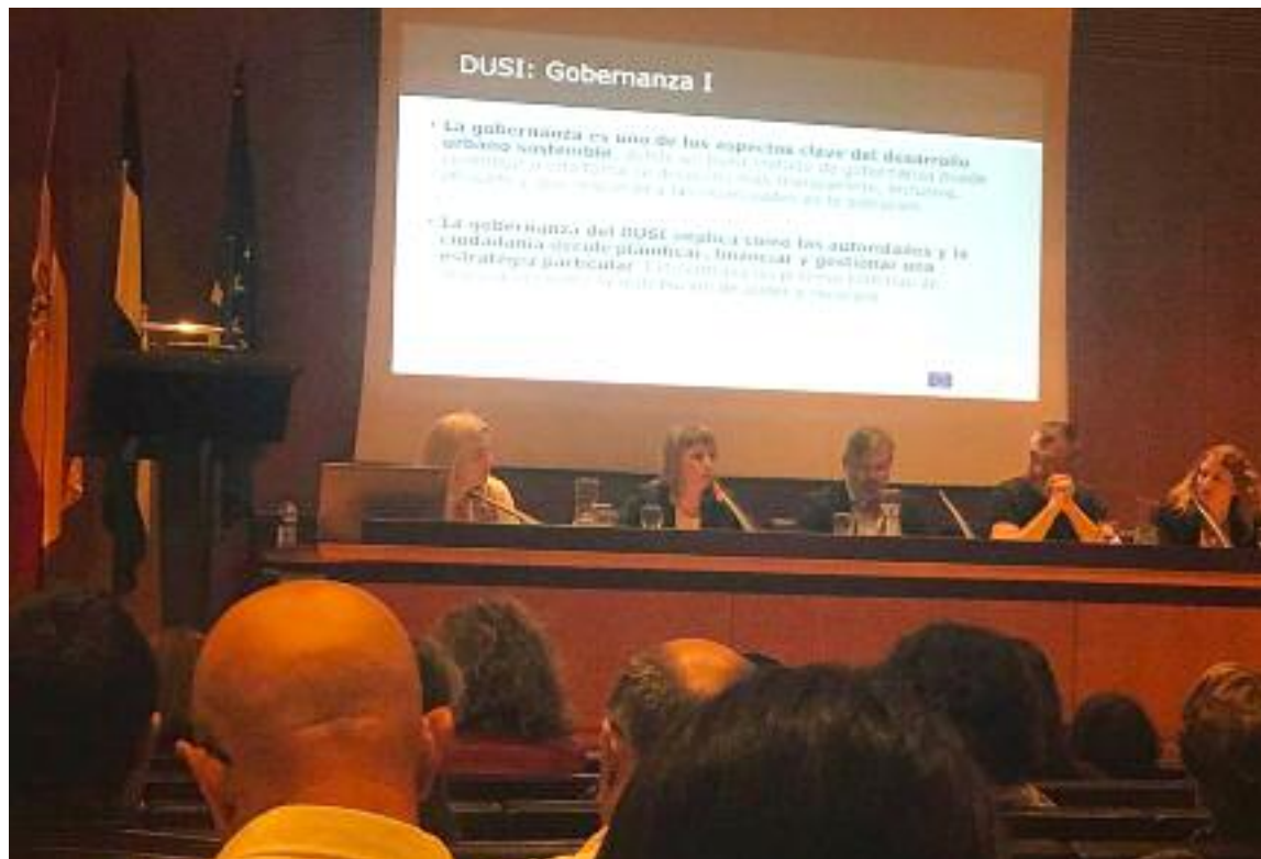
Una de las mesas del encuentro celebrado ayer en Cádiz y en el que estuvo representado el Ayuntamiento de Teruel